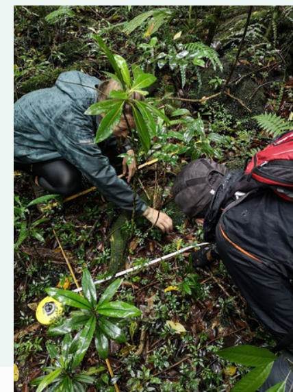
Campagne d'inventaire terrain pour évaluer les degrés d'invasion

Mise en œuvre & amélioration des CAPACITÉS OPÉRATIONNELLES