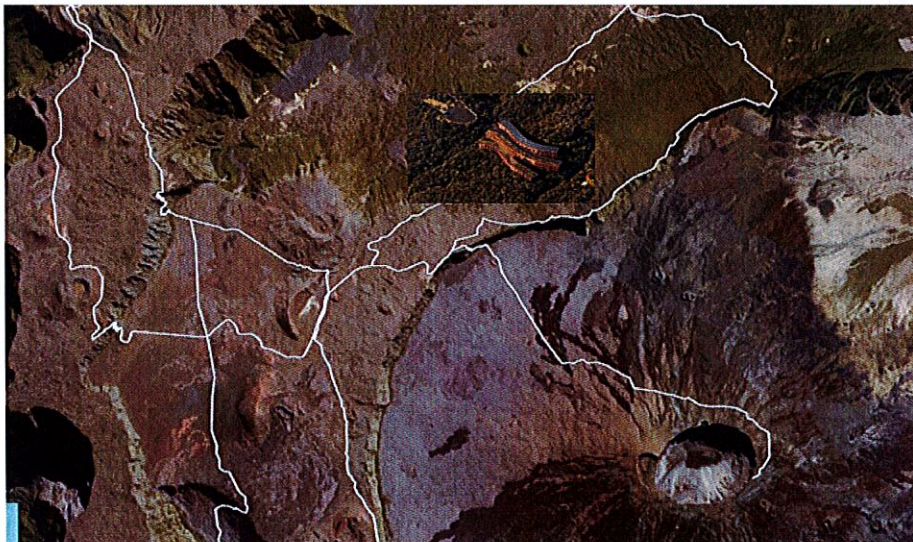
Implantation du nouveau gîte

Les travaux commencés en 2020 arrivent à leur terme, et la livraison du nouveau gîte est prévue en décembre 2023. Le nouveau gîte serait mis en exploitation en janvier 2024. Les travaux sur ce secteur ne sont néanmoins pas terminés : la démolition de l'ancien gîte se déroulera durant le 1 er trimestre 2024.