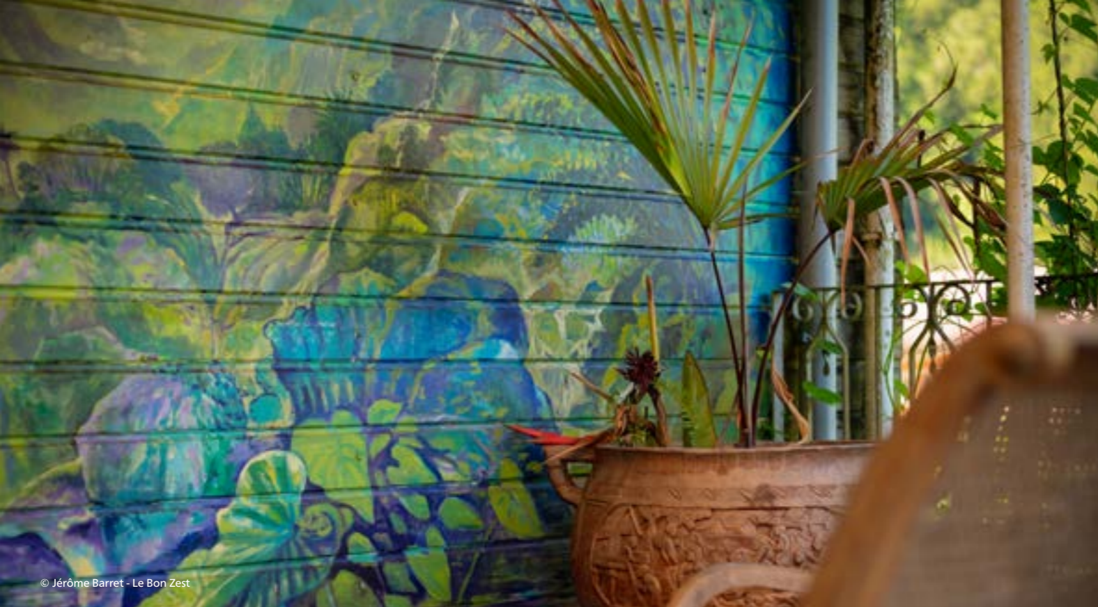
© Jérôme Barret - Le Bon Zest